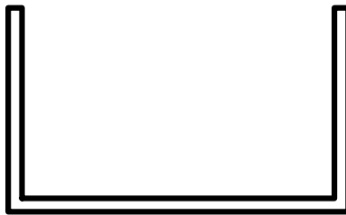
Bodenbefestigung der Schalldämmwände aus verzinktem Stahlblech